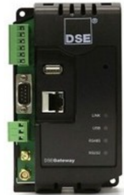
DSE webnet Gateway 890/891

Módulo que permite conectar las centrales con un dataserver DSE mediante una conexión ethernet ó GPRS e incluye funciones GPS.