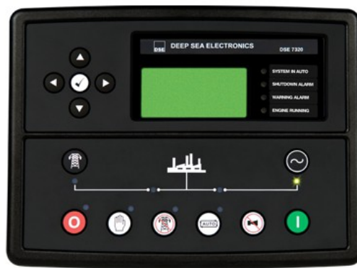
Central DSE 7320