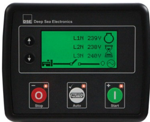
Central DSE 4510